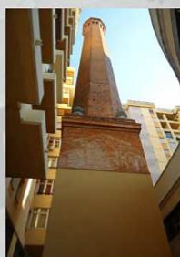
CENTRAL ELÉCTRICA "LA MALAGUETA"